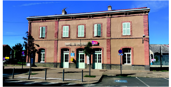
Dans les gares ou autres espaces immobiliers disponibles dans les coeurs de bourgs