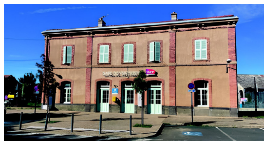
Dans les gares ou autres espaces immobiliers disponibles dans les coeurs de bourgs